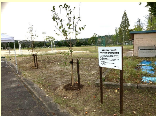
記念植樹(紅白のハナミズキ)