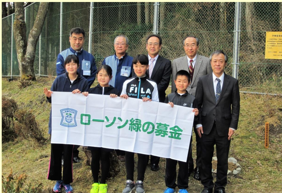
付知北小学校の6年生児童と出席者の皆さん

今後は、ビオトープに生物が増えるとともに、児童の皆さんが様々な生き物に興味を持ち、触れて学びながら、ふるさとの自然や緑を大切にする心を持って成長していくことを願っています。