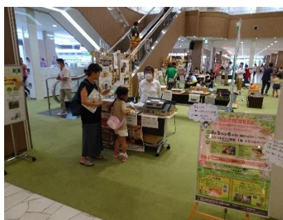
ぎふ木育WEEK（カラフルタウン岐阜）