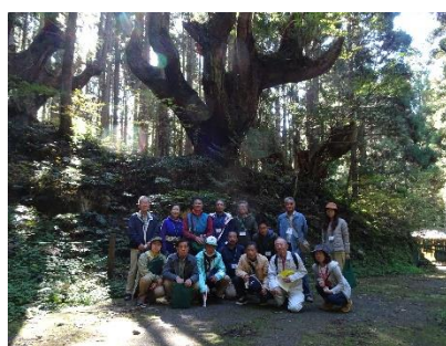
参加者全員で記念写真