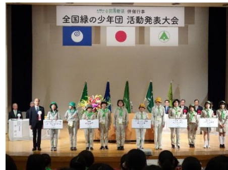
表彰（みどりの奨励賞を受賞）