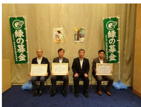
緑の募金感謝状贈呈