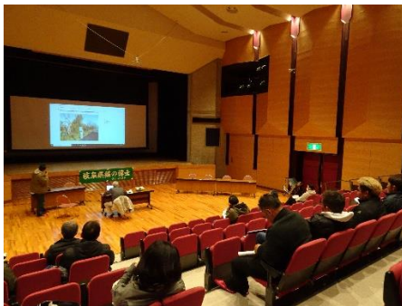
樹木セミナー（講義）

参加者 50名 内 容 ○ 樹木診断・樹勢回復等の事例についての発表 ○ 臥龍桜の現況と今後の課題についての講義