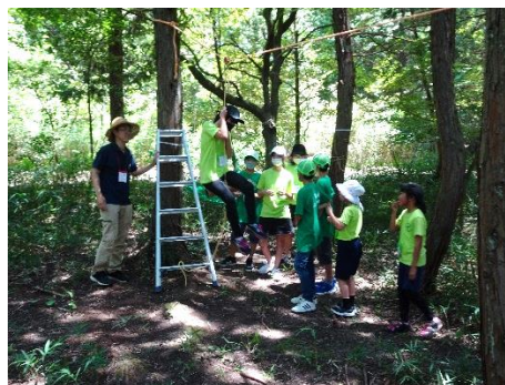
木のロープスライダー