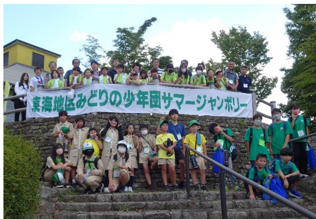
参加者全員で記念写真 (三重県上野森林公園)