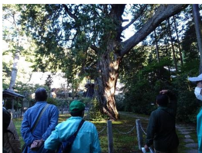
大智寺の大ヒノキ見学