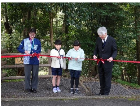
完成記念式典（城山小学校）