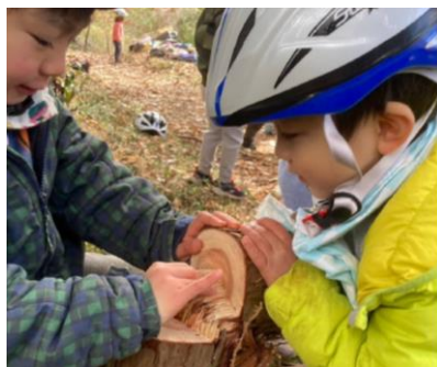
伐採体験 (こどもの庭)