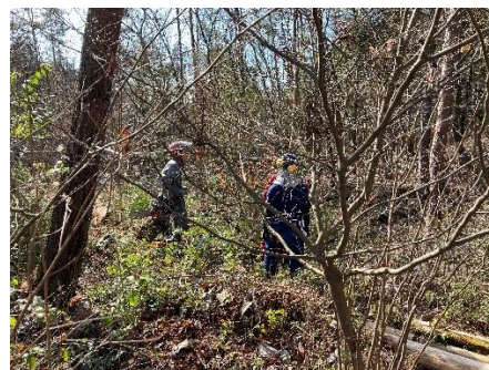
枯松伐採作業 (いのちもり)