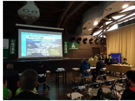
付知南小学校の発表（森林文化アカデミー）