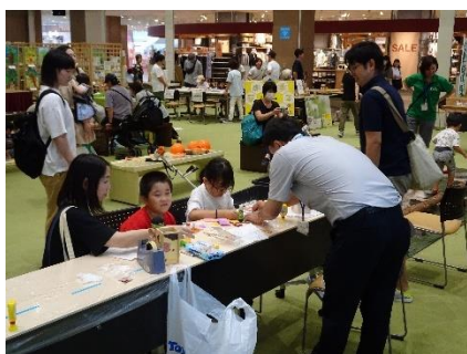
ぎふ木育WEEK（カラフルタウン岐阜）