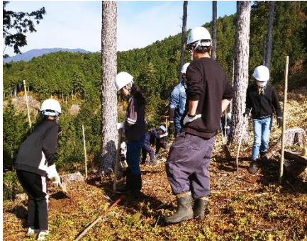
卒業記念植樹（中津川市田瀬）