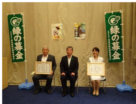
緑化功労者会長表彰を受けられた皆さん (ホテルグランヴェール岐山)