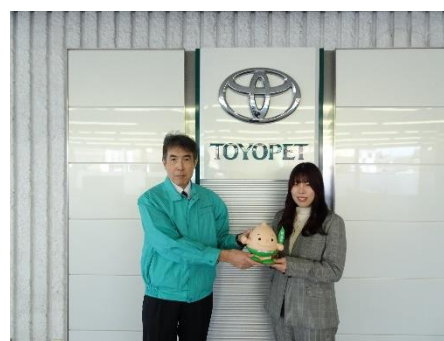
団体からの募金 (岐阜トヨペット株式会社)