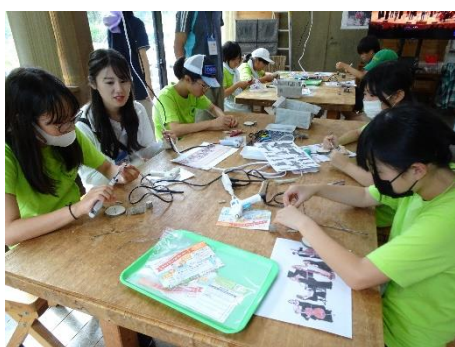
森のオーケストラ作り