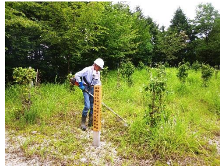
植栽地の下刈り（中津川市田瀬）