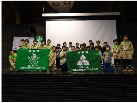
発表少年団全員で記念写真