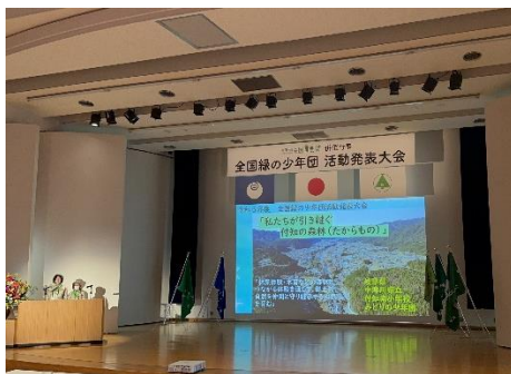
付知南小学校みどりの少年団の発表（茨城県）