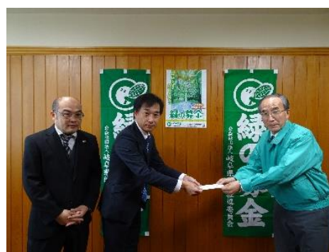
団体からの募金（岐阜中央ライオンズクラブ）