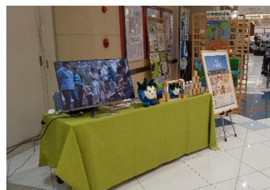
ぎふ木育WEEK(イオン岐阜店)