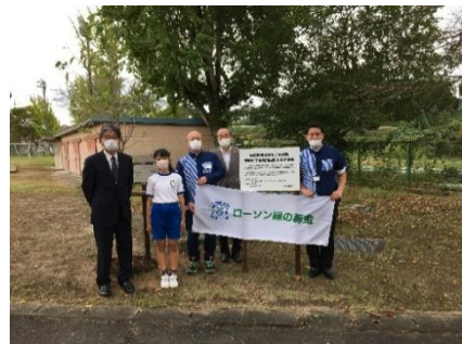
完成記念式典（東明小学校）