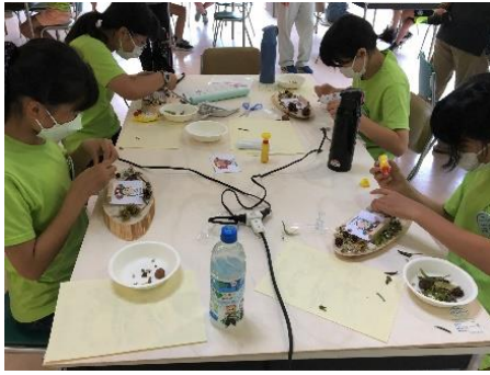
フォトフレームづくり