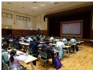
樹木セミナー(講義)