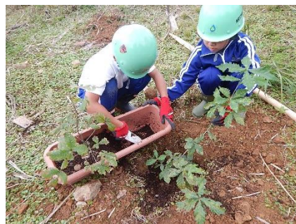
徳山ダムコア山の植樹活動（揖斐川町）