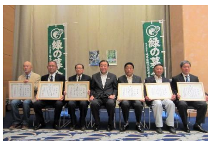
緑化功労者会長表彰を受けられた皆さん (ホテルグランヴェール岐山)