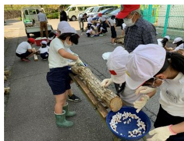
シイタケ菌打ち体験（外山小学校）