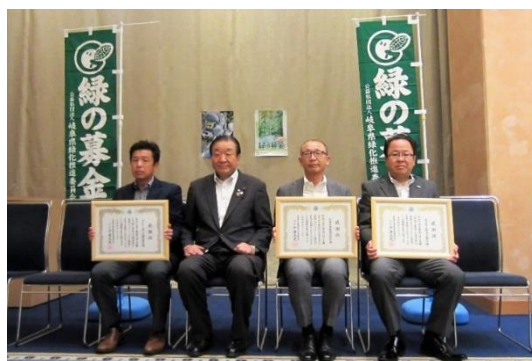
緑の募金感謝状贈呈