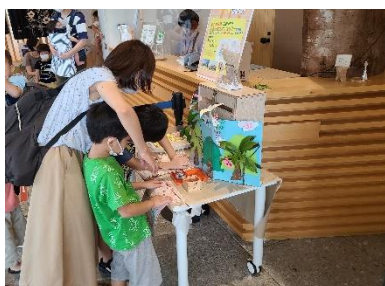
ぎふ木育WEEK(ぎふ木遊館)