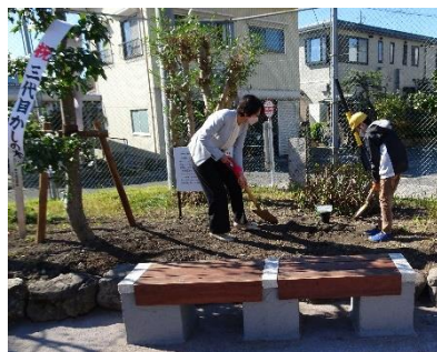
かしの木の植樹（府中小学校）