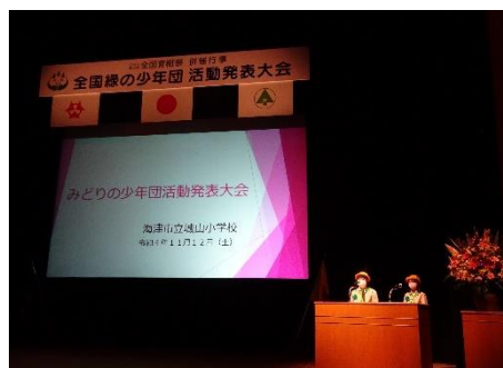
城山小学校みどりの少年団の発表（大分市）

開催場所 大分県大分市 i i c h i k o 総合文化センター 音の泉ホール