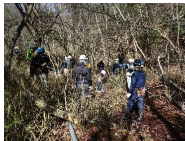
シデコブシ自生地での作業説明