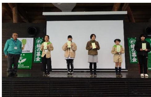
発表した5団の表彰（森林文化アカデミー）