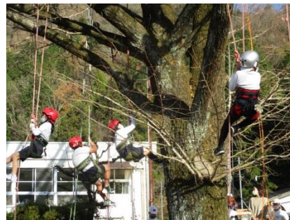
ツリークライミング