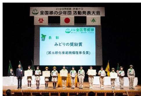
表彰（みどりの奨励賞を受賞）