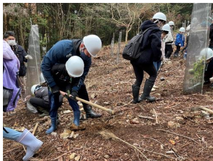
伐採跡地に広葉樹を植樹（本巢市文殊）