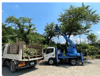
樹木の剪定作業（本巢市立外山小学校）