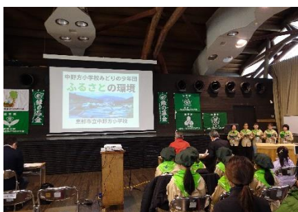
中野方小学校の発表（森林文化アカデミー）