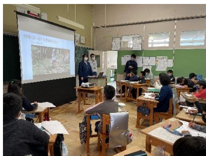
森林学習（室内）（付知南小学校）