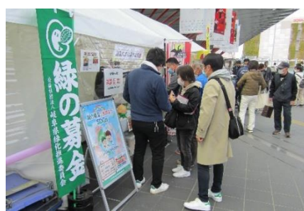
街頭募金の様子 (JR岐阜駅北口)