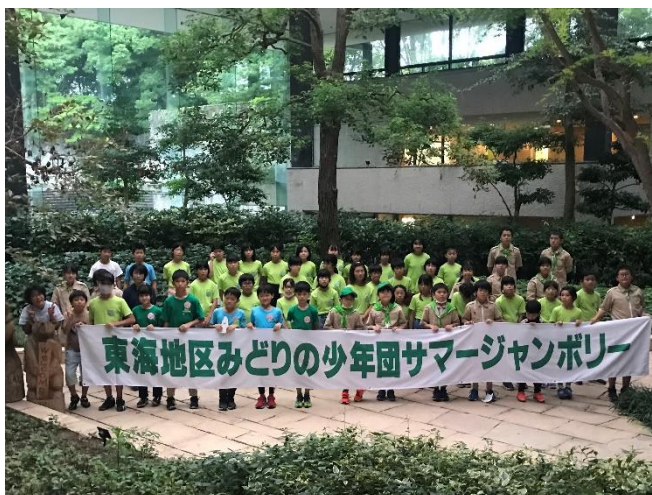
参加者全員で記念写真 （愛知県緑化センター）