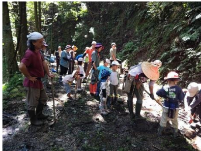
森のようちえん活動（揖斐川町）