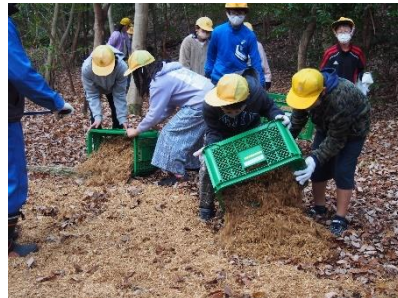
学校林の整備（可児市立旭小学校）