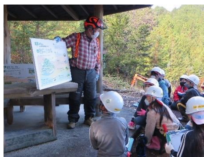
森林学習（屋外）（付知南小学校）