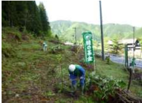
植樹活動（郡上市明宝畑佐）