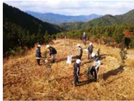
小学6年生の卒業記念植樹（中津川市福岡町）