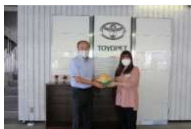
企業からの募金（岐阜トヨペット）