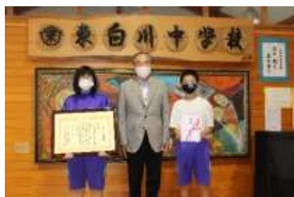
表彰状伝達（東白川中学校緑化少年団）

東白川中学校緑化少年団がみどりの奨励賞（国土緑化推進機構理事長賞）を受賞し、第44回全国育樹祭の併催行事の「全国緑の少年団活動発表大会」に参加できなかったが、開催されなかったため、表彰状を伝達した。