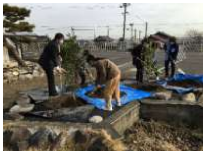
キンモクセイ、ギンモクセイの植栽（下多度小学校）