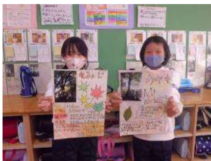
樹木新聞づくり (城山小学校3年生)