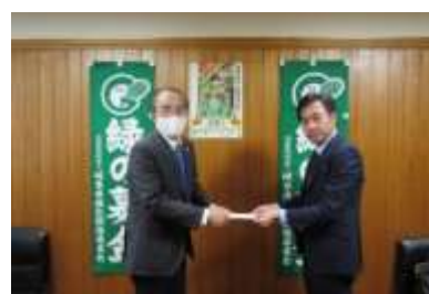
団体からの募金（岐阜中央ライオンズクラブ）