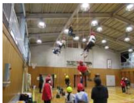
ツリークライミング体験 (外山小学校)