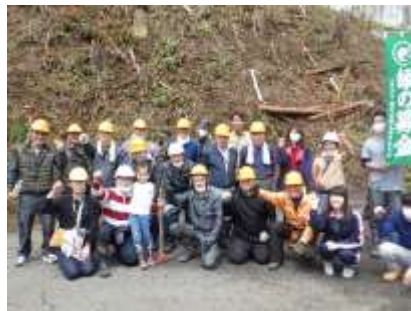
恵みの森づくり事業（郡上市八幡町初納）