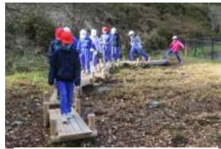
木道の渡り初め（加子母小学校）