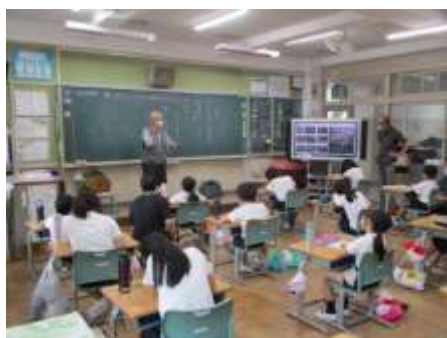
外山小学校 自然学習 (本巢市)