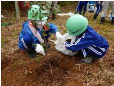
徳山ダムコア山へ小学生が植栽（揖斐川町）