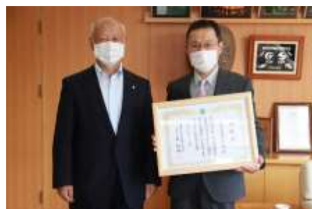
（郡上市長 明宝山里研究会）