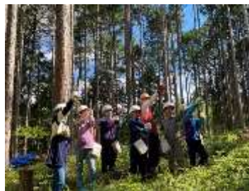
中野方小学校みどりの少年団（恵那市）