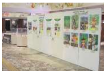
ぎふ木育WEEK2020 パネル展示

日 時 令和2年8月2日（日） ～10日（月、祝日） 場 所 JR岐阜駅アクティブG 参加人員 440人