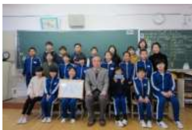
北方小学校みどりの少年団（揖斐川町）

最優秀賞のみどりの少年団を優良少年団として公益社団法人国土緑化推進機構へ推薦しているが、北方小学校みどりの少年団が国土緑化推進機構の内規により推薦できないので、優秀賞の中野方小学校みどりの少年団を推薦することにした。