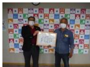
（西濃緑化推進協議会）