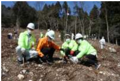
広葉樹の植栽（大野町野区）