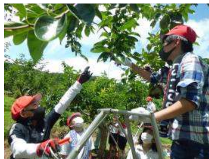
カキの栽培体験 (城山小学校5年生)