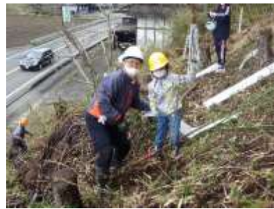
広葉樹の植栽（郡上市八幡町初納）