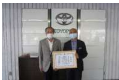
緑の募金感謝状贈呈（岐阜トヨペット）