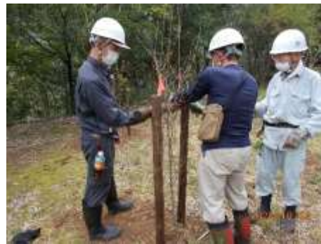
ヤマボウシの植樹（岐阜市）