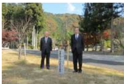
谷汲緑地公園（揖斐川町）