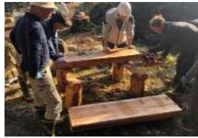
テーブル・ベンチの作成（野区）