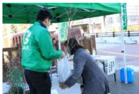
植木の配布（大垣市丸の内公園）