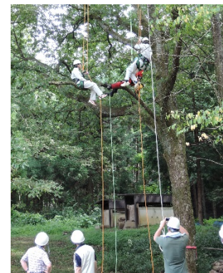
講義とロープクライミング の状況