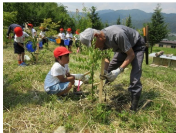
ふれあいの森林づくり事業(付知町)