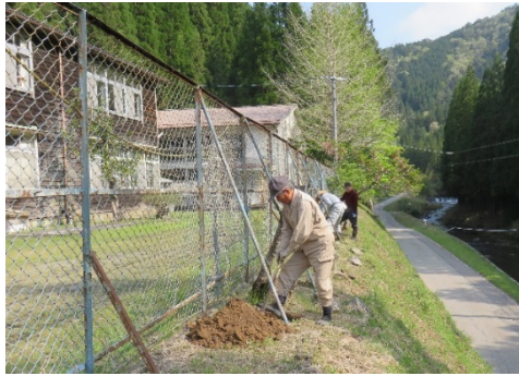
小那比自治会の桜植栽状況