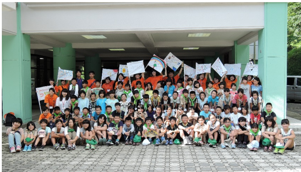
参加者全員で記念撮影

内容 交流会、火おこし体験、野外炊飯、体験学習(ウォークラリー、伊勢型紙、紙漉き、カヤック)、キャンプファイヤー 他