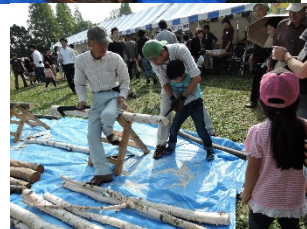
森と木とのふれあいフェア開催状況