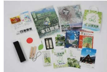
提供したグッズ 他