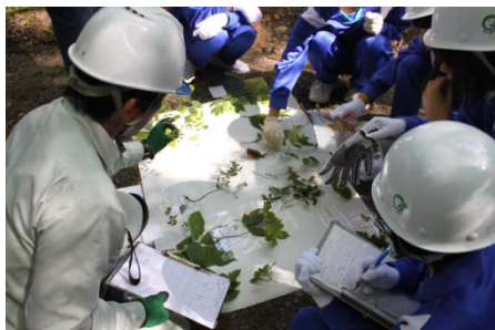
小里川ダム里山教室