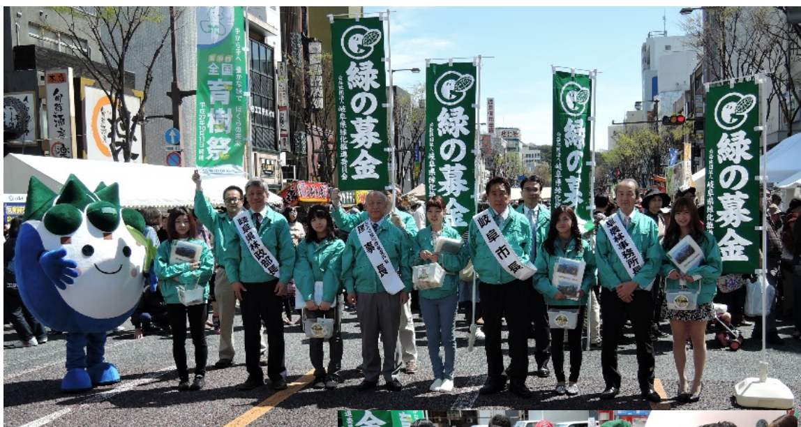
「道三まつり」会場での 街頭募金の状況 (岐阜市若宮町通り)

募金種類別の割合は、家庭募金84%、企業募金9%、職場募金4%、以下、街頭募金、学校募金の順となっている。