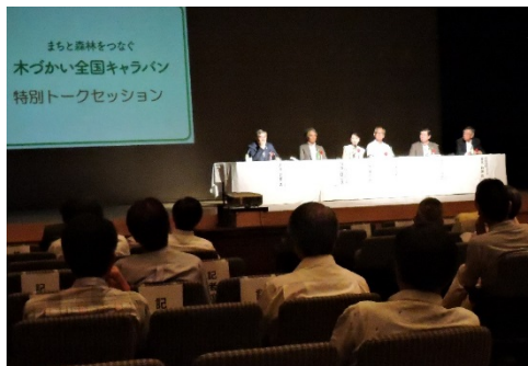
トークセッション

日 時 平成27年8月1日(土)～2日(日) 場 所 じゅうろくプラザ、JR岐阜駅前北口広場、アクティブG 参加人員 3,000人