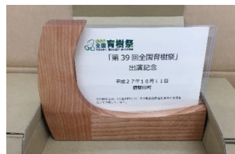
贈呈したフォトフレーム